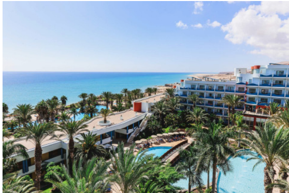
BU: R2 Pajara Beach.