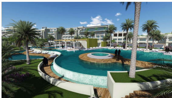
BU: Steigenberger Pure Lifestyle.