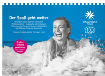
BU: Kampagnenmotiv für den Winter 2018/19.

Telefon: +49 203 99405 810, simone.feier-leist@schauinsland-reisen.de