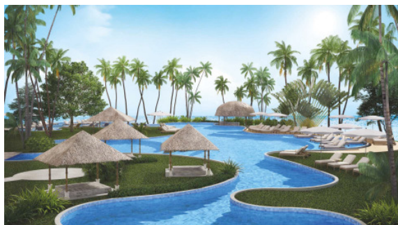
BU: Eden Beach Resort & Spa.