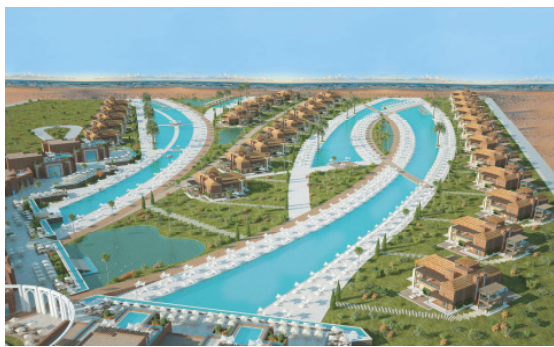
BU: Albatros Sea World Marsa Alam.