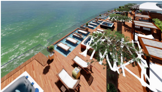
BU: Atlantic Mirage*****