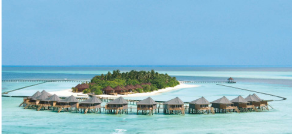
BU: Komandoo Island Resort & Spa****+