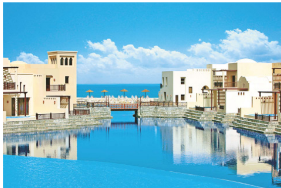
BU: The Cove Rotana Resort*****