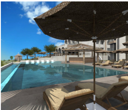
BU: Cactus Mare***** auf Kreta.