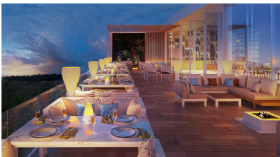
BU: Steigenberger Pure Lifestyle***** in Ägypten.